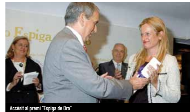
Accésit al premi "Espiga de Oro"

L'any 2010, EROSKI ha estat reconegut com a col·laborador oficial de la campanya Europa Energia Sostenible, la iniciativa més gran de la Unió Europea per promoure les energies sostenibles.