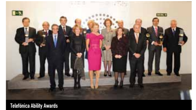
Telefónica Ability Awards

EROSKI ha obtingut un accésit al premi Espiga de Oro que concedeix la Federació Espanyola de Banc d'Aliments (FESBAL) per la nostra ajuda als més necessitats a través de les campanyes de recollida d'aliments.