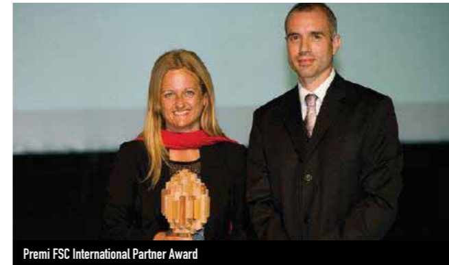
Premi FSC International Partner Award